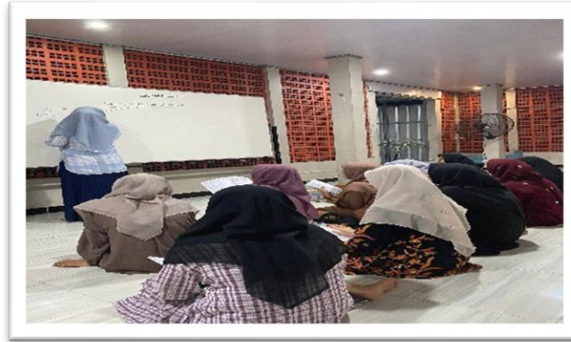
Gambar 1. Kegiatan pembelajaran bab Nun Sukun dan Tanwin