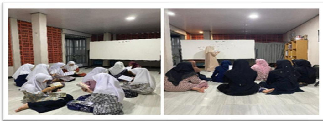
Gambar 2. Proses pendampingan tahsin Al-Qur'an (kiri) Kegiatan pembelajaran makharijul huruf (kanan)