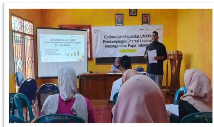
Gambar 5. Kegiatan Penyampaian Materi Literasi Laporan Keuangan dan Pajak Tahunan

Sesi pendampingan perpajakan diawali dengan penyampaian materi tentang hak dan kewajiban perpajakan UMKM secara umum. Peserta diberikan pemahaman mengenai pengertian wajib pajak, jenis-jenis pajak yang relevan bagi usaha mereka, serta pentingnya memiliki NPWP sebagai identitas perpajakan. Banyak peserta yang sebelumnya enggan mendaftarkan diri sebagai wajib pajak karena persepsi negatif tentang besarnya beban pajak. Persepsi ini diluruskan dengan menjelaskan secara rinci fasilitas PPh Final 0,5% yang berlaku bagi UMKM dengan peredaran bruto tidak melebihi Rp4,8 miliar per tahun, sesuai ketentuan PP 55 Tahun 2022 [7].