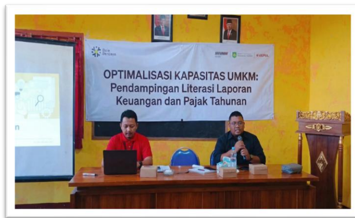
Gambar 3. Kegiatan Penyampaian Materi Sosialisasi UMKM

Sesi pelatihan literasi laporan keuangan dilaksanakan dengan pendekatan pembelajaran praktis, di mana peserta langsung diajak mengerjakan lembar kerja berisi transaksi fiktif yang mencerminkan kondisi usaha nyata sehari-hari. Materi dimulai dari konsep paling dasar, yakni pengertian aset, kewajiban, dan ekuitas, kemudian berlanjut ke pencatatan jurnal sederhana, pembuatan buku kas harian, hingga penyusunan laporan posisi keuangan dan laporan laba rugi sesuai SAK EMKM. Penggunaan bahasa yang sederhana dan contoh yang relevan dengan usaha peserta terbukti sangat efektif dalam mempercepat pemahaman [11].