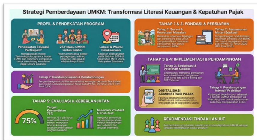
Gambar 1. Tahapan Pelaksanaan Kegiatan Pengabdian

Kegiatan Pengabdian Kepada Masyarakat ini dirancang dengan metode komprehensif yang secara integral memadukan pendekatan partisipatif dengan strategi pendampingan intensif. Melalui pendekatan ini, pelaku UMKM diposisikan bukan sekadar sebagai objek penerima manfaat, melainkan subjek aktif dan mitra yang terlibat penuh dalam seluruh rangkaian kegiatan, mulai dari fase perencanaan awal, identifikasi kebutuhan usaha yang akurat, pelaksanaan kegiatan, hingga evaluasi program secara kolaboratif. Pemilihan metode ini didorong oleh prinsip fundamental bahwa perubahan perilaku dan peningkatan keterampilan yang berkelanjutan dapat dicapai secara lebih efektif melalui keterlibatan langsung dan rasa kepemilikan program yang kuat, dibandingkan dengan pendekatan instruktif top-down semata [2]. Selain edukasi partisipatif, strategi pelaksanaan ini juga mengintegrasikan prinsip TAM (Technology Acceptance Model) untuk mendorong adopsi teknologi yang relevan, serta 'Voluntary Compliance' untuk membangun kemandirian usaha dan kesadaran sukarela dalam pengelolaan keuangan dan perpajakan.