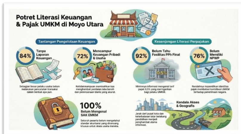
Gambar 2. Potret Literasi Keuangan dan Pajak UMKM di Moyo Utara

Hasil survei awal menggambarkan kondisi pengelolaan keuangan UMKM di Kecamatan Moyo Utara yang masih jauh dari standar yang diharapkan. Dari 25 UMKM yang menjadi peserta, sebanyak 84% mengaku tidak pernah membuat laporan keuangan dalam bentuk apapun, 72% tidak memisahkan keuangan usaha dari keuangan pribadi, dan 100% belum mengetahui SAK EMKM sebagai standar akuntansi yang dirancang khusus untuk skala usaha mereka. Temuan ini sejalan dengan berbagai kajian yang menyebutkan bahwa ketiadaan pencatatan keuangan yang teratur menyebabkan pelaku usaha tidak mampu mengetahui laba bersih, menentukan harga jual berbasis biaya, maupun merencanakan perkembangan usaha [2].