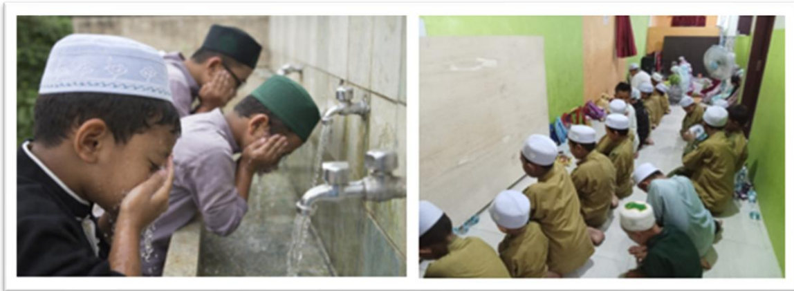
Gambar 2 Praktik Wudhu dan sholat berjama'ah oleh santri

Selain itu, grafik pada Gambar 4 menunjukkan distribusi kemampuan peserta dalam praktik wudhu.