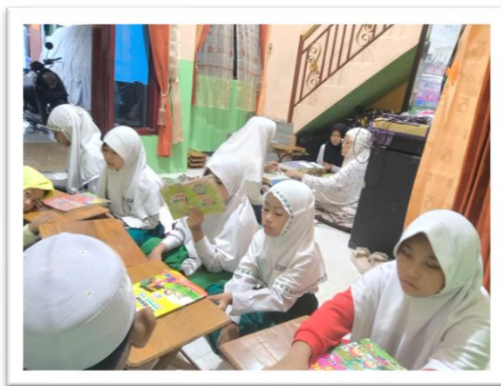
Gambar 1 Kegiatan Ngaji Subuh di TPQ Zawiyah Tahfidz Assa'diyyah

Setelah pelaksanaan program, hasil observasi menunjukkan adanya peningkatan kedisiplinan dan keterlibatan anak dalam kegiatan mengaji. Hal ini sejalan dengan teori pembiasaan (habit formation) yang menyatakan bahwa pengulangan aktivitas secara konsisten dapat membentuk perilaku (An-Nahlawi, 1995). Dengan demikian, kegiatan Ngaji Subuh tidak hanya meningkatkan kemampuan membaca Al-Qur'an, tetapi juga membentuk karakter disiplin pada anak