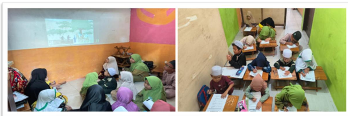
Gambar 4. Program Jum'at Edukatif: Menonton Kisah Nabi dan Menulis/Mewarnai

Kegiatan storytelling terbukti efektif dalam menanamkan nilai moral seperti kejujuran, kesabaran, dan tanggung jawab. Hal ini sejalan dengan penelitian Suyadi (2013) yang menyatakan bahwa pembelajaran kreatif dapat meningkatkan fokus dan motivasi belajar anak usia dini.