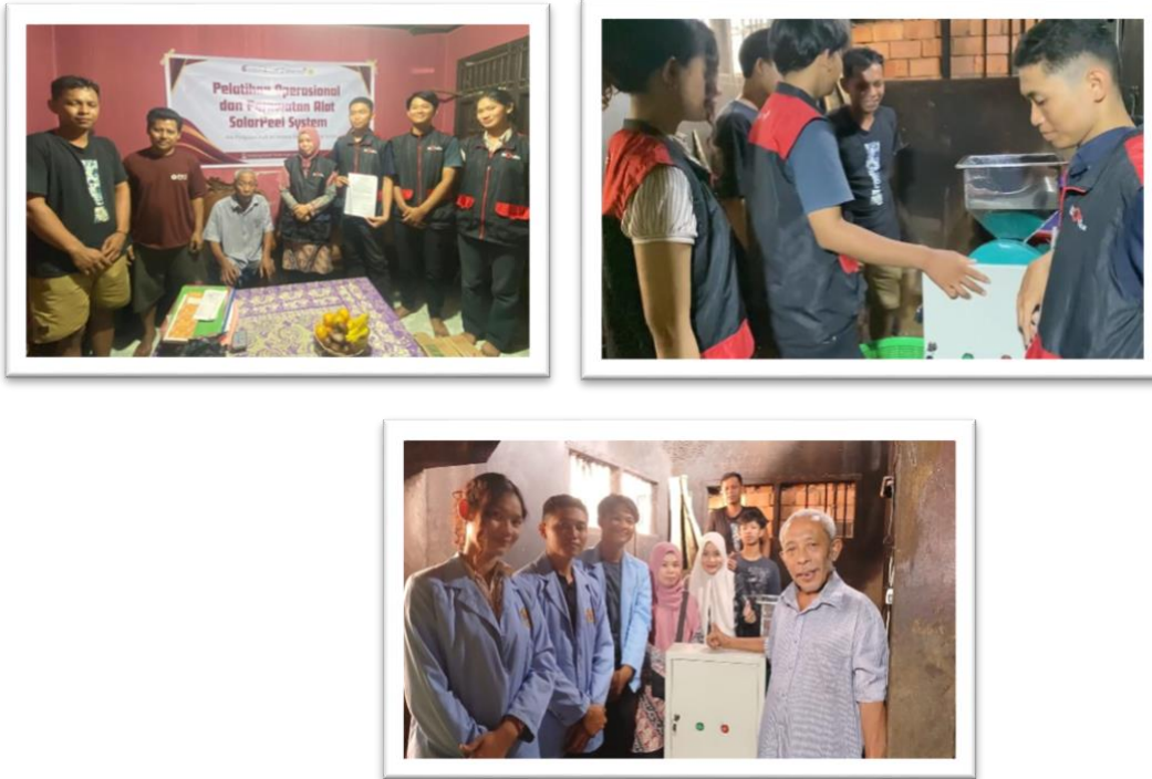
Gambar 3. Sesi Pelatihan Pengoperasian dan Perawatan SolarPeel System kepada Mitra UMKM Kopti Lestari

Dampak : Mitra menunjukkan kemampuan dalam melakukan perawatan mandiri terhadap unit panel surya dan baterai setelah melalui sesi pelatihan intensif. Peningkatan kapasitas ini mengubah peran mitra dari sekadar pengguna menjadi subjek yang mandiri dalam mengelola teknologi tepat guna.