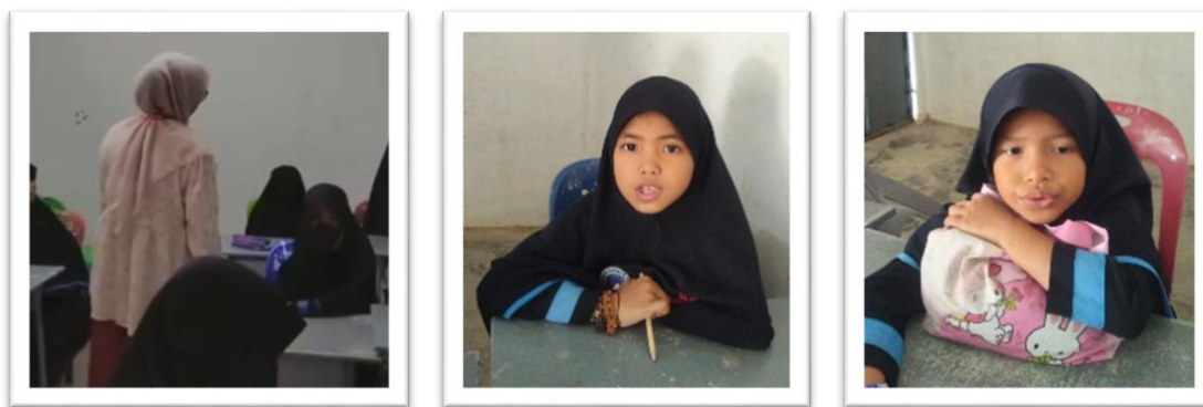
Gambar 3. Pendampingan dan refleksi hafalan siswa

Tahap implementasi program dilaksanakan melalui kegiatan tahfidz harian, muroja'ah terjadwal, tadabbur Al-Qur'an, serta pembiasaan ibadah rutin di lingkungan sekolah. Seluruh kegiatan dilakukan secara partisipatif dengan pendampingan intensif dari guru tahfidz. Proses ini diperkuat dengan tahap pendampingan dan refleksi yang dilakukan secara berkala untuk memantau perkembangan siswa serta memberikan umpan balik terhadap capaian hafalan dan sikap religius.