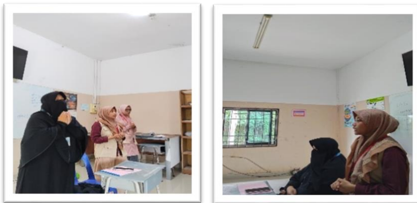
Gambar 1. Observasi saat mengulang hafalan (muroja'ah) bersama

Observasi partisipatif diterapkan untuk menilai keterlibatan siswa dalam kegiatan tahfidz, khususnya pada aktivitas muroja'ah bersama, setoran hafalan, serta ibadah rutin seperti shalat berjamaah dan tadabbur Al-Qur'an. Melalui keterlibatan langsung pengamat dalam aktivitas tersebut, diperoleh data yang lebih autentik mengenai konsistensi hafalan, motivasi belajar, serta perilaku religius siswa. Pendekatan ini tidak hanya menangkap perilaku yang tampak, tetapi juga interaksi sosial yang menyertainya, seperti dukungan teman sebaya dan respon guru. Dengan demikian, metode ini efektif dalam mengevaluasi program tahfidz yang menekankan aspek religius, sikap, dan pembiasaan, sehingga memberikan gambaran yang komprehensif terhadap keberhasilan program.