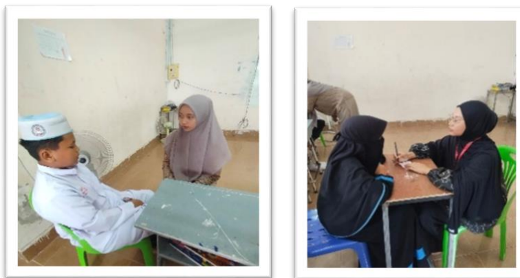
Gambar 2. Wawancara terhadap siswa tahfidz

Wawancara semi-terstruktur dilakukan dengan guru tahfidz dan siswa terpilih. Pertanyaan dirancang untuk menggali pengalaman mereka terkait hambatan dalam proses hafalan, kesulitan emosional, serta perubahan sikap setelah mengikuti program. Dengan teknik ini, peneliti memiliki kerangka pertanyaan yang jelas namun tetap fleksibel, sehingga memungkinkan eksplorasi lebih mendalam sesuai konteks. Kelebihan wawancara semi-terstruktur adalah mampu menangkap narasi personal siswa tentang pengalaman religius dan dinamika pembelajaran yang tidak selalu teramati dalam observasi.