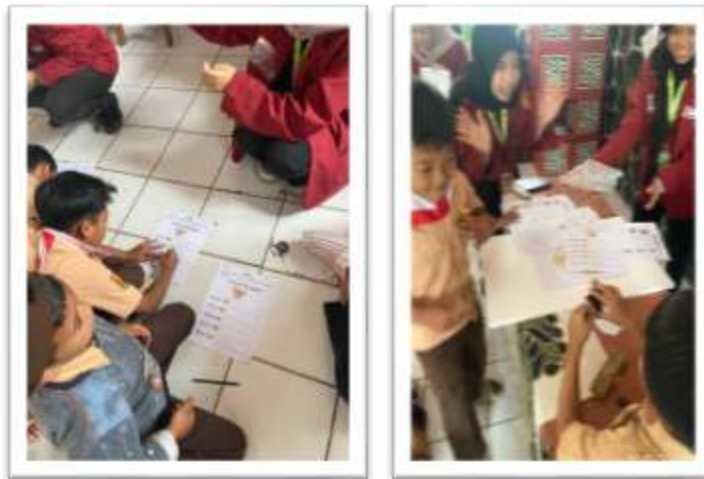
Gambar 3. Pengerjaan Pree-Test dan Post-Test

Pada saat penayangan animasi wayang, pengajar memberikan beberapa pertanyaan pemantik yang singkat untuk siswa. Siswa yang bisa menjawab dengan cepat dan tepat akan diberi bintang sebagai tanda apresiasi. Hal tersebut bisa membuat siswa lebih fokus dan berlomba untuk mendapatkan bintang lebih banyak.