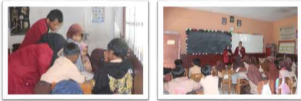
Gambar 4. Pelaksanaan Pembelajaran Berbasis Problem Based Learning

tiga tahap yang dikerjakan oleh para siswa yaitu pretest secara mandiri, Lembar Kerja Peserta Didik (LKPD) yang dikerjakan secara berkelompok, dan terakhir posttest secara mandiri.