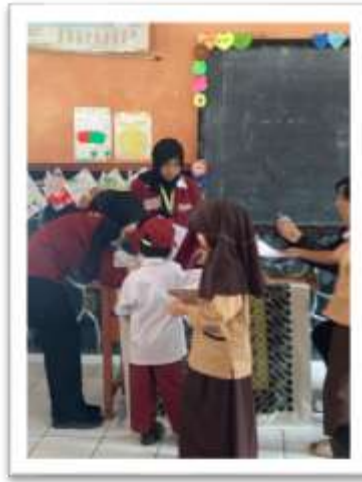
Gambar 2. Pemberian Bintang

mengenai Pancasila dan implementasinya dalam kehidupan sehari-hari. Kegiatan ini bertujuan untuk meningkatkan minat belajar, melatih kemampuan menyimak, serta menanamkan nilai-nilai karakter dan budaya sejak dini.