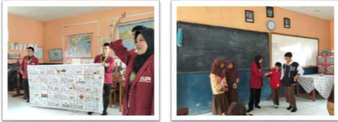
Gambar 5. Pelaksanaan Pembelajaran Berbasis Permainan Ular Tangga

Pada pelaksanaannya, peserta didik dibagi ke dalam kelompok kecil beranggotakan lima orang melalui metode berhitung secara berurutan agar pembagian kelompok berlangsung cepat dan merata, selaras dengan teori pembelajaran berbasis permainan dalam Kurikulum Merdeka PPKn yang menekankan pengembangan potensi siswa melalui aktivitas interaktif untuk meningkatkan motivasi dan mengatasi kebosanan materi teoritis.