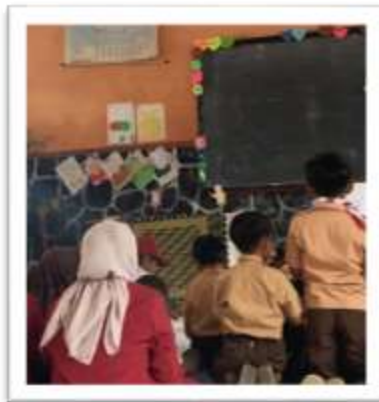
Gambar 1. Pembelajaran berbasis wayang

Media berbasis budaya lokal, seperti wayang, dinilai memiliki potensi besar sebagai sarana pendidikan karakter karena mengandung nilai-nilai moral, sosial, dan spiritual yang dapat diinternalisasikan melalui cerita [9]. Wayang tidak hanya sarat pesan, tetapi juga dekat dengan kehidupan masyarakat Indonesia, sehingga penggunaannya dalam format digital seperti video edukatif mampu meningkatkan daya tarik dan keterlibatan siswa dalam pembelajaran. Dalam era digital, integrasi antara teknologi pendidikan dan kearifan lokal menjadi langkah strategis untuk menciptakan pengalaman belajar yang bermakna dan kontekstual.