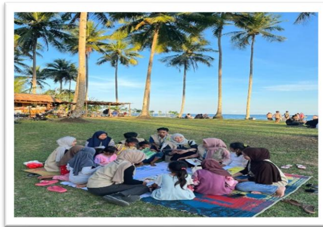
Gambar 2. Pelaksanaan Taman Baca di Wisata Sunrise Wasaga

Hasil akhir dari fokus kolaborasi multipihak ini menunjukkan bahwa TBM Sunrise Wasaga telah berkembang menjadi "social institution" di tingkat komunitas yang diakui dan didukung oleh berbagai stakeholder, memiliki role yang jelas dalam ekosistem literasi lokal, dan memiliki sistem governance yang lebih inclusive dan collaborative. Hal ini menciptakan kondisi yang lebih kuat untuk sustainability, karena TBM tidak lagi bergantung pada satu atau dua orang, tetapi tersebar di dalam jaringan relasi dan komitmen multipihak. Pengalaman kolaborasi ini juga menjadi learning yang berharga bagi komunitas tentang bagaimana pemberdayaan masyarakat dapat dicapai melalui kerjasama yang sistematis, saling menghormati, dan fokus pada tujuan bersama untuk meningkatkan kualitas hidup dan literasi masyarakat (Agustiani, 2021; Sonani, 2025).