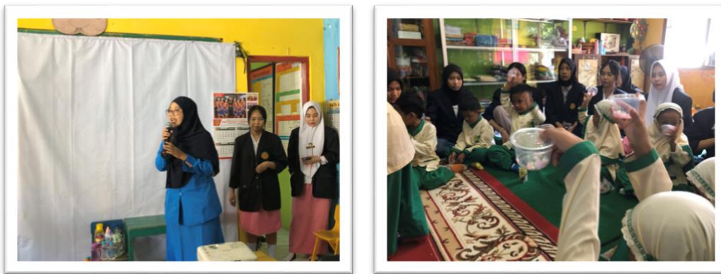
Gambar 1. Sesi Diskusi dan Cerita Anak (kiri). Kegiatan Pendukung meronceng (Kanan)

Kegiatan pengabdian ini memberikan dampak positif baik bagi anak, guru, maupun orang tua. Anak-anak menunjukkan peningkatan kesadaran terhadap tubuh dan batasan privasi. Guru memiliki keterampilan baru dalam mengintegrasikan materi CSE ke dalam kegiatan belajar mengajar, sedangkan orang tua menjadi lebih terbuka untuk melanjutkan edukasi di rumah. Sebagai tindak lanjut, pihak PAUD berkomitmen untuk menayangkan video edukasi secara berkala dan mengadaptasi modul pelatihan ini dalam kegiatan tematik harian. Tim pengabdian juga berencana memperluas program ke PAUD lain di wilayah Surakarta dan sekitarnya.