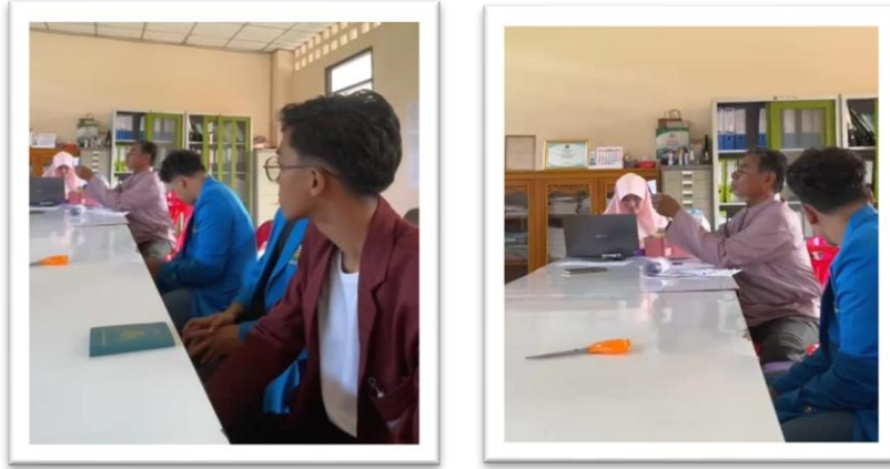
Gambar 2 Lobbying Terhadap Pihak Sekolah

Tahap kedua adalah implementasi metode pembelajaran dengan menekankan pada aktivitas praktik langsung dan penggunaan media visual. Dalam pengenalan bahasa Indonesia, siswa didorong untuk mempraktikkan ungkapan sapaan sederhana dan perkenalan diri yang relevan dengan interaksi sehari-hari. Sementara pada aspek budaya, tim menyajikan materi mengenai keberagaman tarian, pakaian adat, hingga kuliner khas Nusantara melalui laptop dan video dokumenter. Kombinasi antara pendekatan komunikatif ( communicative approach ) dan pemanfaatan media audiovisual terbukti mampu memicu rasa ingin tahu siswa secara mendalam. Pembelajaran tidak lagi terasa menjemukan karena siswa diajak berinteraksi dengan materi yang bersifat visual dan praktis.