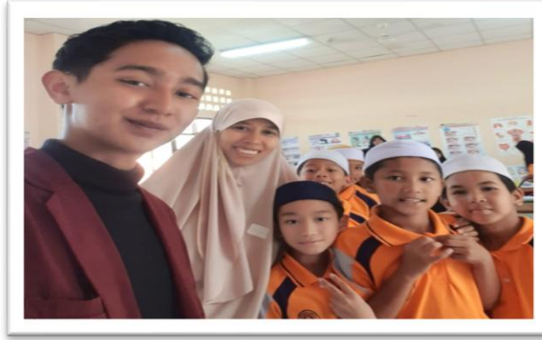
Gambar 1 Observasi

Kondisi ini menunjukkan adanya tantangan faktual dalam sistem pembelajaran di sekolah tersebut, di mana metode pengenalan bahasa asing seringkali masih terpaku pada buku teks tanpa adanya praktik komunikatif yang menarik [1]. Padahal, pengenalan budaya sejak dini merupakan instrumen penting dalam membentuk perspektif global siswa dan menumbuhkan toleransi serta minat terhadap pertukaran budaya [2]. Pendekatan Communicative Language Teaching (CLT) yang dipadukan dengan pengenalan budaya interaktif diyakini mampu mendorong siswa untuk lebih aktif, percaya diri, dan antusias dalam mempelajari bahasa baru [3]. Pembelajaran yang melibatkan media visual dan audiovisual terbukti jauh lebih efektif dalam memberikan pemahaman yang mendalam mengenai identitas sebuah bangsa dibandingkan metode ceramah konvensional [4].