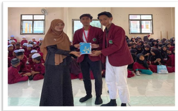
Gambar 5 Pengesahan Kamus 5 Bahasa

Luaran utama dari kegiatan pengabdian ini adalah dihasilkannya produk nyata berupa Kamus Kosakata Harian 5 Bahasa (Indonesia, Thailand, Melayu, Arab, dan Inggris) yang dilengkapi dengan ilustrasi menarik. Kamus ini disusun secara kolaboratif bersama guru sekolah untuk memastikan kosakata yang dimuat benar-benar dibutuhkan oleh siswa dalam interaksi sehari-hari. Penggunaan gambar pada setiap kosakata bertujuan untuk mempermudah ingatan visual siswa, sehingga mereka dapat mempelajari bahasa Indonesia secara mandiri di luar jam pelajaran kelas.