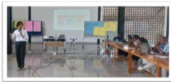
Gambar 3. Pemaparan Materi Manajemen Keuangan Sekolah

Berdasarkan kegiatan pada hari kedua ditemukan bahwa RKAS sudah disusun dan disahkan oleh DikNas, 2) Kepala dan Bendahara Sekolah mendapatkan pendampingan dari DikNAs untuk pengisian RKAS, 3) ada sekolah yang hanya mendapatkan Dana BOS saja, 4) Penguasaan teknologi informasi menjadi kebutuhan bagi para Bendahara Sekolah, 5) Penambahan sumber dana dan program pada aplikasi excel diluar pendanaan dan RKAS untuk penyusunan Program Kerja tahunan, dan 6) Perlunya pelatihan pajak untuk keperluan manajemen keuangan sekolah.