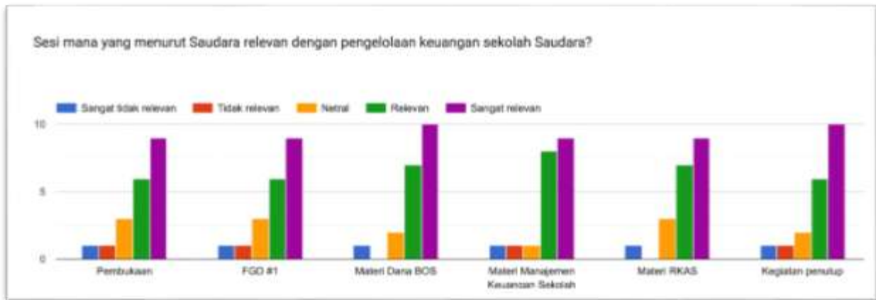
Gambar 6. Tingkat Relevansi Materi Manajemen Keuangan Sekolah

Secara keseluruhan kegiatan pkm ini sudah berjalan dengan lancar dan para kepala-bendahara sekolah yang mengikuti kegiatan ini antusias serta mendapatkan peningkatan literasi manajemen keuangan sekolah serta manajemen kepemimpinan. Para peserta mendapatkan dampak langsung dari kegiatan PkM ini dengan adanya sekolah yang menggunakan microsoft excel untuk penyusunan program kerja tahunan. Hal ini membuktikan bahwa kegiatan PkM berdampak dan bermanfaat bagi pelaksanaan manajemen keuangan sekolah. Salah satu indikator keberhasilan pelatihan adalah implementasi materi pelatihan pada kehidupan sehari-hari (Anif, et. Al., 2019; Rochmawati et.al., 2019; Bagian materi RKAS dan cara pengelolaan RKAS menjadi dua materi yang paling membantu dalam pengelolaan keuangan sekolah, serta pemahaman baru tentang akuntansi dasar dan pelaporan keuangan adalah materi yang dinilai penting dalam manajemen keuangan, tidak hanya di sekolah namun juga keuangan pribadi