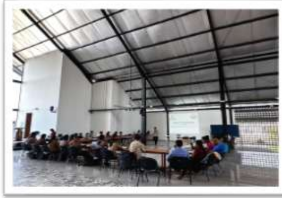
Gambar 1. Pemaparan materi oleh Narasumber

Narasumber memberikan materi kasus yang terkait dengan kepemimpinan. Hasil pengamatan jalannya kegiatan pada hari pertama menunjukkan beberapa hal, yaitu 1) Kepala dan Bendahara sekolah mempunyai kemampuan memimpin yang baik seperti terlihat dalam interaksi selama diskusi kasus, 2) FDG berlangsung dengan baik dan dinamis, semua pihak terlibat secara aktif, 3) Terdapat sekolah yang mempunyai permasalahan belum cairnya dana BOS, 4) Kesepakatan bersama bahwa menaikkan uang sekolah bukan solusi atas permasalahan kekurangan dana sekolah dan 5) Perlunya evaluasi bulanan di tingkat sekolah secara konsisten. Kelima temuan ini kemudian digunakan untuk melengkapi materi hari kedua yaitu manajemen keuangan sekolah. Peran temuan dalam desain pelatihan adalah hal yang penting untuk memastikan tercapainya tujuan pelatihan (Laila, et al., 2024)