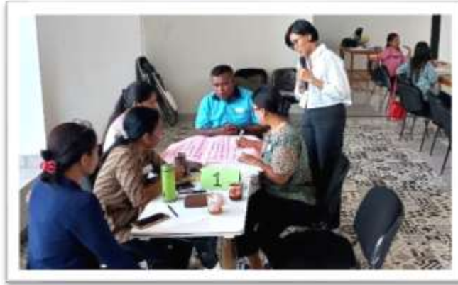
Gambar 2. Narasumber Mendampingi FGD

Berdasarkan kegiatan pada hari kedua ditemukan bahwa RKAS sudah disusun dan disahkan oleh DikNas, 2) Kepala dan Bendahara Sekolah mendapatkan pendampingan dari DikNAs untuk pengisian RKAS, 3) ada sekolah yang hanya mendapatkan Dana BOS saja, 4) Penguasaan teknologi informasi menjadi kebutuhan bagi para Bendahara Sekolah, 5) Penambahan sumber dana dan program pada aplikasi excel diluar pendanaan dan RKAS untuk penyusunan Program Kerja tahunan, dan 6) Perlunya pelatihan pajak untuk keperluan manajemen keuangan sekolah.