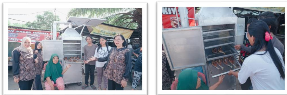
Gambar 3 Pelatihan dan Pendampingan Menggunakan Alat Pengasapan Pirolisis