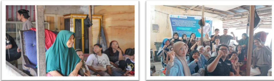
Gambar 2 Pelatihan dan Pendampingan Menggunakan Aplikasi manajemen stok barang.

penyuluhan dan antusias dalam berdiskusi.