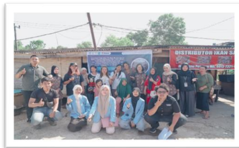
Gambar 4 Dokumentasi Bersama Peserta Sosialisasi

Kegiatan edukasi dan pendampingan penggunaan teknologi pengasapan pirolisis dan aplikasi manajemen stok barang telah berhasil meningkatkan pemahaman serta keterampilan mitra dan masyarakat dalam mengoperasikan teknologi tersebut. Sebelum pelatihan, hasil pre-test menunjukkan bahwa tingkat pemahaman peserta terhadap teknologi pengasapan pirolisis dan sistem sistem informasi manajemen keuangan digital berada pada rata-rata 15%, dengan tidak ada satu pun peserta yang memiliki pengetahuan memadai tentang kedua teknologi tersebut. Setelah melalui serangkaian pelatihan intensif dan pendampingan selama empat minggu, hasil post-test menunjukkan peningkatan signifikan dengan tingkat pemahaman peserta mencapai rata-rata 89-95% tergantung pada aspek evaluasi yang diukur. Berdasarkan hasil evaluasi, sekitar 92% mitra dan masyarakat yang sebelumnya mengalami kesulitan dalam mengatasi permasalahan asap akibat proses produksi ikan salai, kini mampu mengatasi permasalahan tersebut dengan menggunakan alat pengasapan ikan salai modern dengan ruang pengasapan tertutup dan asap yang dihasilkan dikonversi menjadi asap cair.