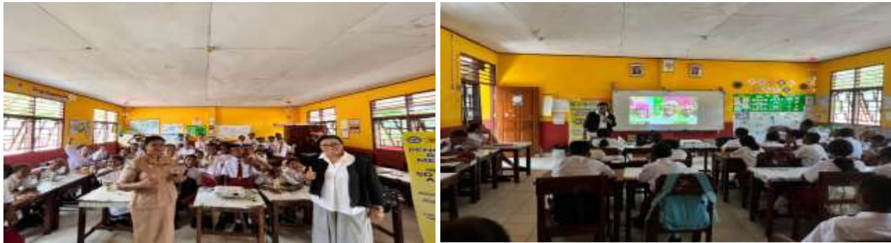
Foto kegiatan pengabdian bersama guru walikelas dan siswa kelas VI SDN II Abepura.

Pihak sekolah sangat berterima kasih dengan materi yang disampaikan dan mengharapkan agar pihak universitas sebagai mitra dapat terus menunjang proses pengenalan budaya dan juga pengenalan Pasifik kepada siswa/i di sekolah ini.